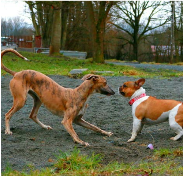
Vorderbeine etwas auseinander - Ohren nach hinten gerichtet - Rute über der Rückenlinie