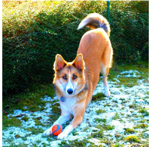
Beine eng und fast parallel - fokussierter Blick

Bei Fragen freue ich mich auf dein E-Mail oder du hinterlässt einen Kommentar direkt auf unserer Facebook Seite – dann profitieren alle davon 🍷