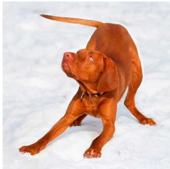
Beine eng und fast parallel - fokussierter Blick